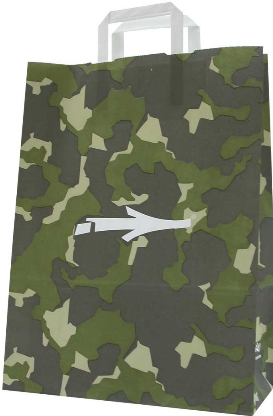
American_art - Papiertaschen mit Papierhenkel