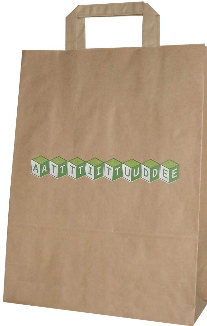
American_art - Papiertaschen mit Papierhenkel