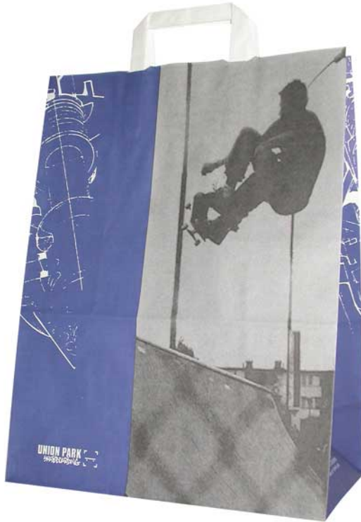
American_art - Papiertaschen mit Papierhenkel

Tragetaschen mit 5-fach gefaltetem Papierhenkel, innen eingeklebt mit Blattverstärkung; obere Kante Zackenschnitt zur Vermeidung von Verletzungen